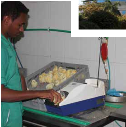
Left: vaccination at a hatchery