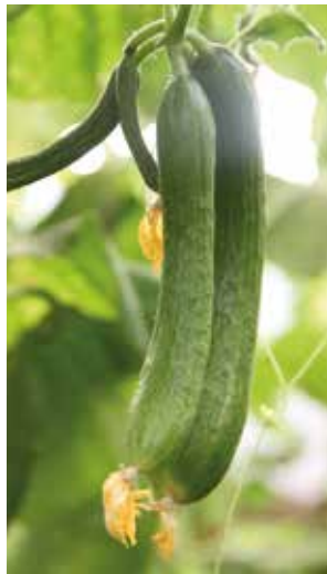
View on the Nile in Khartoum, Sudan. Left: cucumbers in a greenhouse. In Sudan the greenhouses are used for cooling. Below: the Corinthia hotel in Khartoum

Sudan: “It was fascinating to see how eager the entrepreneurs were