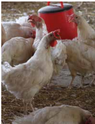
Poulets à la ferme Walila