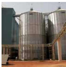
Visite de l'entreprise malienne Les Grands Moulins